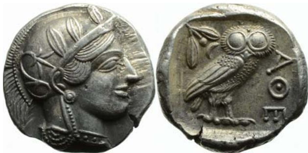
Abbildung: Griechische Tetradrachme mit Athene und Eule

In diesen Seehandelszentren änderte sich zwangsläufig die soziale Struktur der Bevölkerung. Der Stand der Kaufleute gewann mehr und mehr an Bedeutung, die Schicht der Handwerker nahm an Zahl und Wirtschaftskraft zu. Schließlich fand ein einflussreicher Stand von Geldverleihern seine Existenzgrundlage. Die gesteigerte Warenproduktion und der Austausch im Handel hatte nämlich schon in früherer Zeit zu einer revolutionären Erfindung geführt: zur Prägung von Geld aus Edelmetallen. Geld beherrschte von nun an als bequemes Zahlungsmittel den Markt. Fast jede Polis hatte bald ihre eigene Währung.