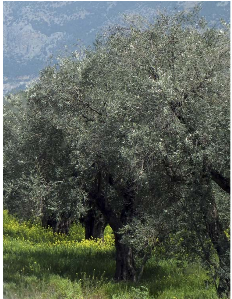
Abbildung: 500 Jahre alte Olivenbäume bei Delphi

450 v. Chr. neben 35 000 bis 40 000 Bürgern mindestens 10 000 männliche Metöken („Mitbewohner“) wohnten. Im ganzen mag Attika um diese Zeit eine Bevölkerung von 300 000 Menschen einschließlich der Frauen, Kinder und Sklaven gehabt haben, von denen gut die Hälfte in Athen selbst gewohnt haben dürfte. (Über die Insel Chios, einen Hauptumschlagplatz für Sklaven, berichtet der Historiker Thukydides, dass auf 30 000 Freie etwa 100 000 Sklaven gekommen seien!)