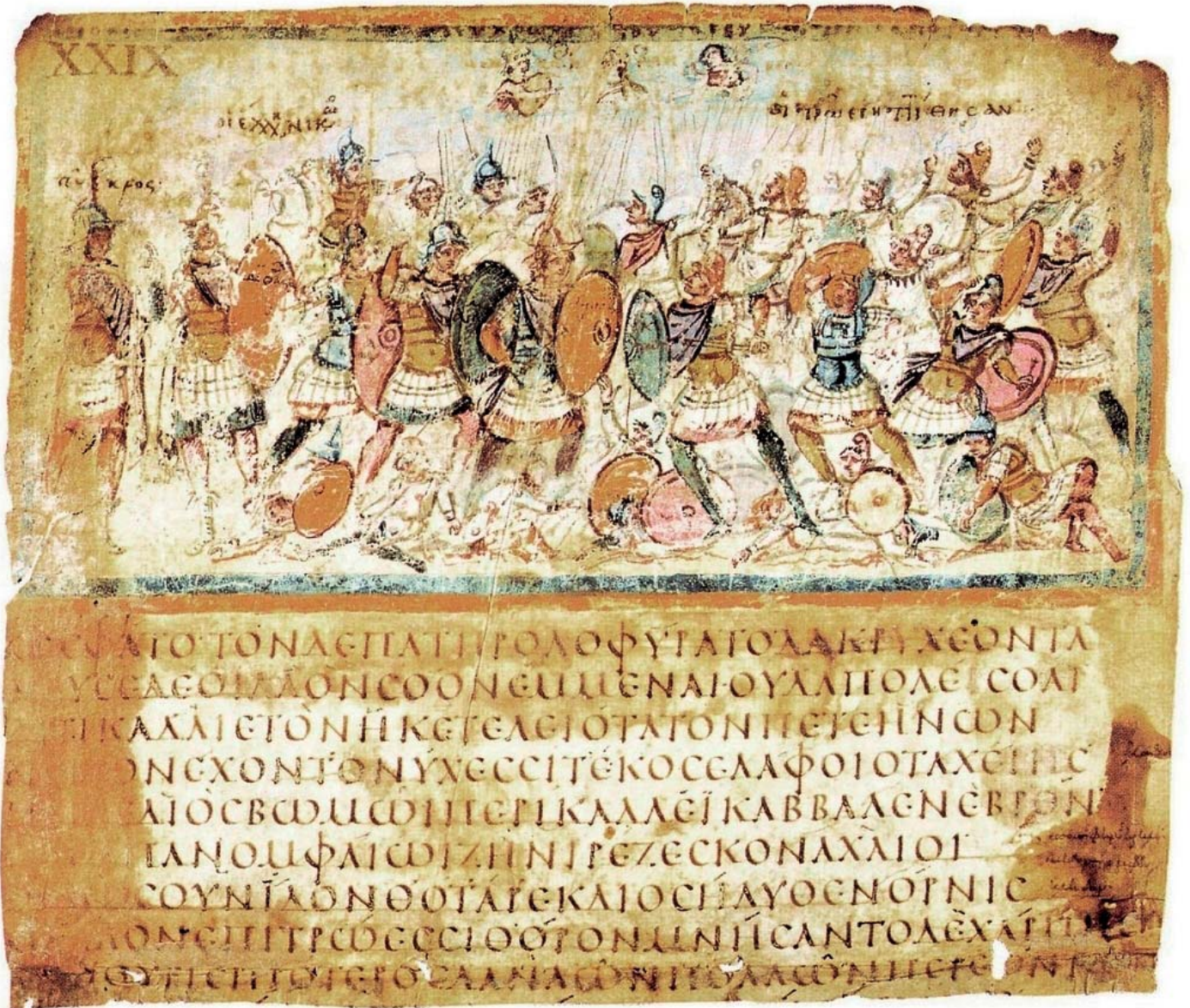
Manuskript F205 der Biblioteca Ambrosiana in Mailand (Ilias Ambrosiana) mit Text und Illustration der Ilias. Aus dem späten 5. oder frühen 6. Jahrhundert n. Chr.